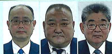
花王(株) (株)東芝 日吉電装(株)